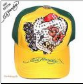
Ed Hardy Cap