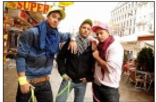
Krocha of the week, KW 16, Quelle: www.krocha.at

Mit zunehmender Popularisierung der Krocha fand gleichzeitig eine Differenzierung der Szene statt, die sich heute je nach Stylingvorlieben in „Stlyer“ und „Zalega“ (von wienerisch „zerlegen“) aufteilt.