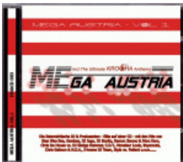
Ultimate Krocha Anthems

Der Begriff „Krocha“ leitet sich aus dem ostösterreichischen „ins Fest/in die Party einetrochn“ ab, was so viel heißt wie: einen besonders effektvollen Auftritt auf einer Clubveranstaltung inszenieren oder besonders exzessiv feiern.