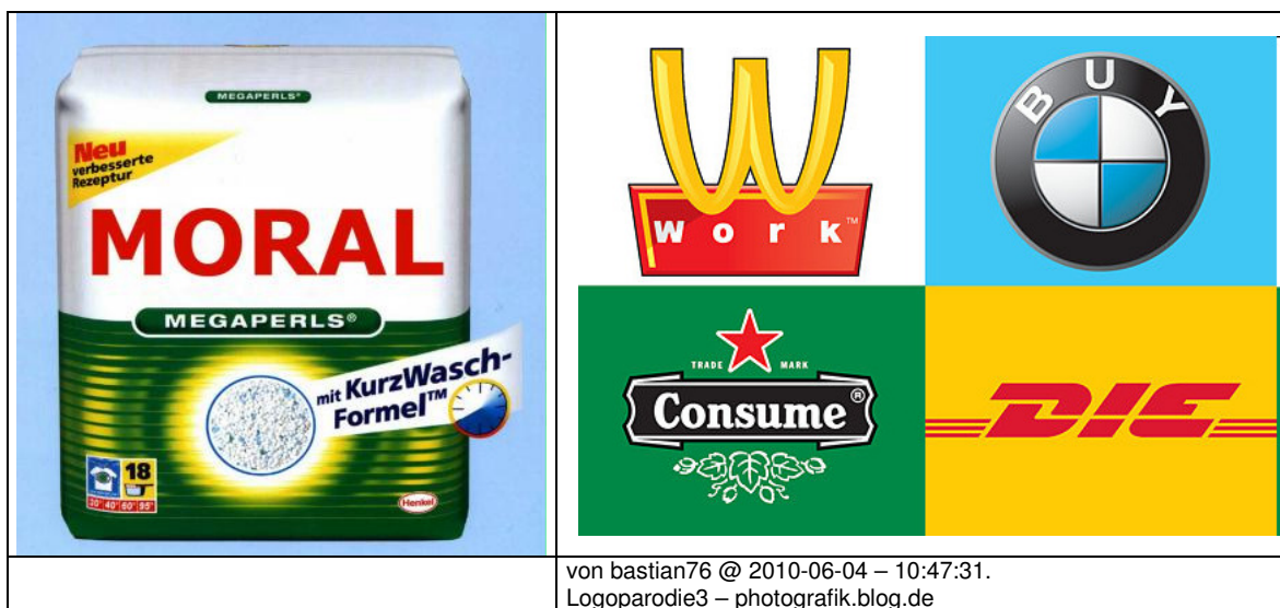
Grafik 3: Beispiele für Logo-Parodien als politisches Statement

Intertextualität ist zweifellos einer der spannendsten Bereiche junger kreativer Ausdruckskulturen. Und sie ist zugleich ein gutes Beispiel dafür, welchen Zugang Jugendliche zu Bildern wie auch zu geschriebenen Texten finden: Ihnen geht es nicht so sehr um den Schöpfer oder die Schöpferin, sondern um die RezipientInnen. Der Intertext „passiert“ nämlich (erst) im Rezeptionsakt.